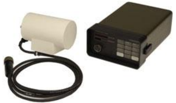
Figura 3: Magnetómetro de Precesión Protónica, Marca Geometrics, Modelo G856

El registro del CMT durante más de cien años fue desarrollado con instrumental analógico clásico. En la actualidad, dicho equipamiento está siendo reemplazado por instrumental digital que facilita y mejora la calidad de registro de las componentes del campo magnético terrestre.