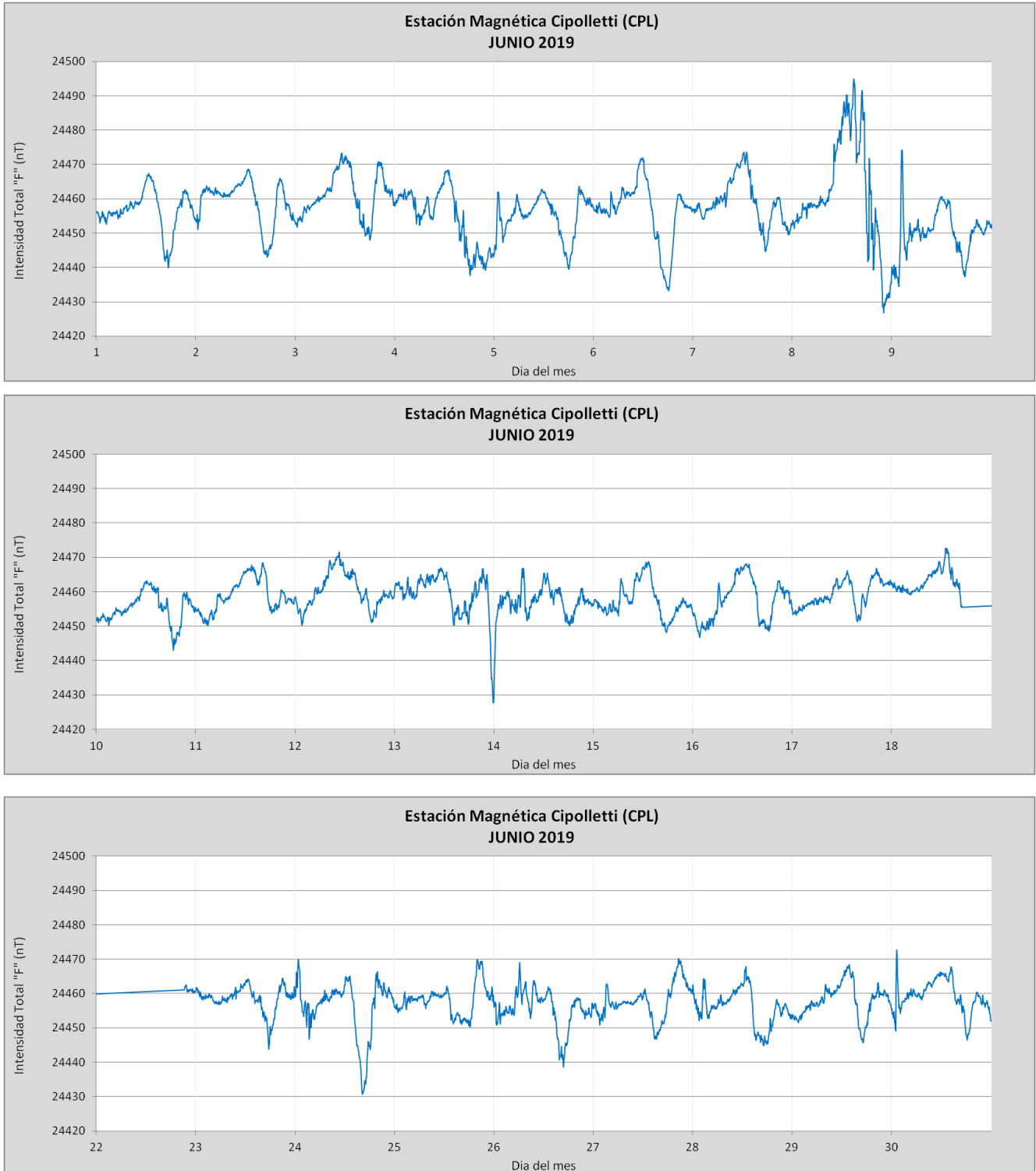
Figuras 5 (a,b,c): Intensidad total del campo magnético en función del tiempo

Se presentan los registros absolutos de F que pudieron obtenerse durante el mes de Junio de 2019. Se muestra también la variación de F según los promedios mensuales desde Noviembre 2015 hasta la Actualidad. Los datos faltantes se deben a inconvenientes en la electrónica del sensor.