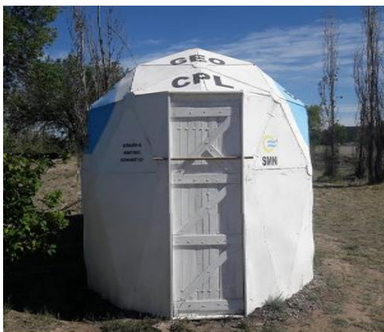
Figura 4: Casilla Geomagnética de la Estación CPL

En gabinete los datos son procesados en una planilla Excel y validados constantemente con los registros de F de la red de Observatorios del país. Se obtienen promedios horarios, mensuales, y anuales. Luego se calculan, utilizando los días calmos establecidos por la IAGA, las curvas de variación diurna para cada mes de registro, y se comparan estos resultados con un índice de actividad geomagnética local, en formatos horarios, trihorarios o diarios.