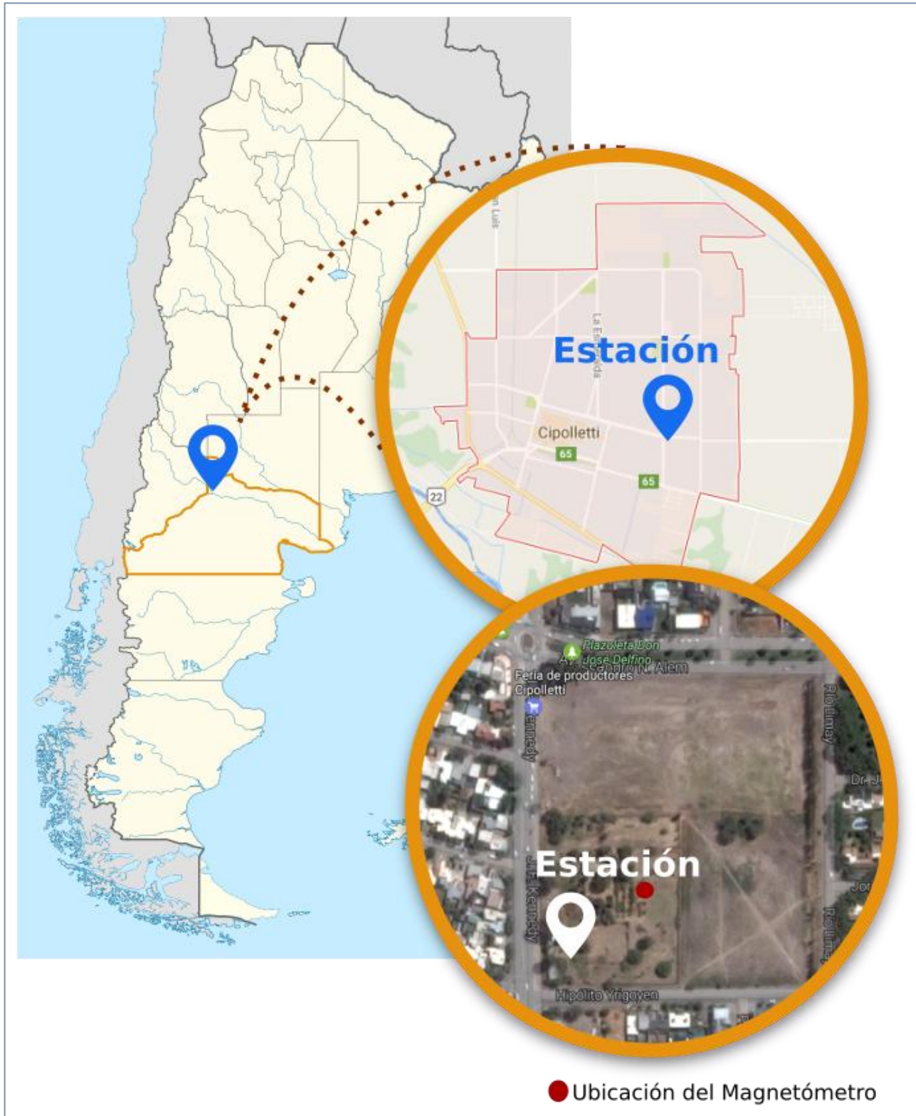
Figura 1: Ubicación de la Estación Cipolletti