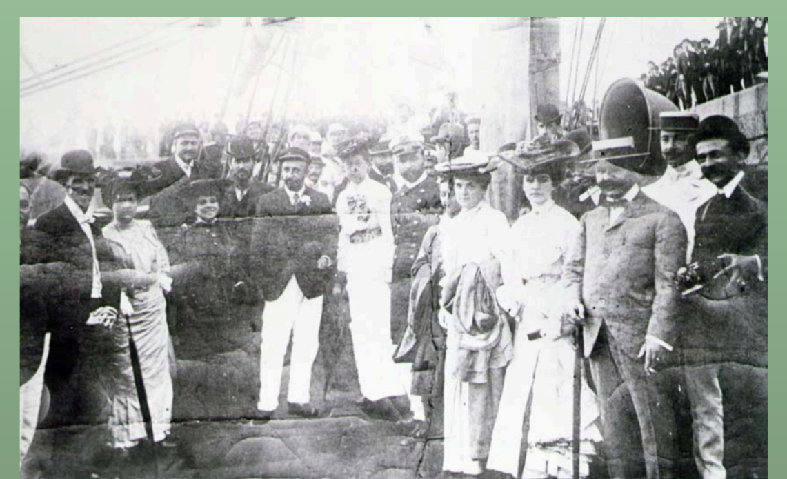
Jean-Baptiste Charcot en el Puerto de Buenos Aires