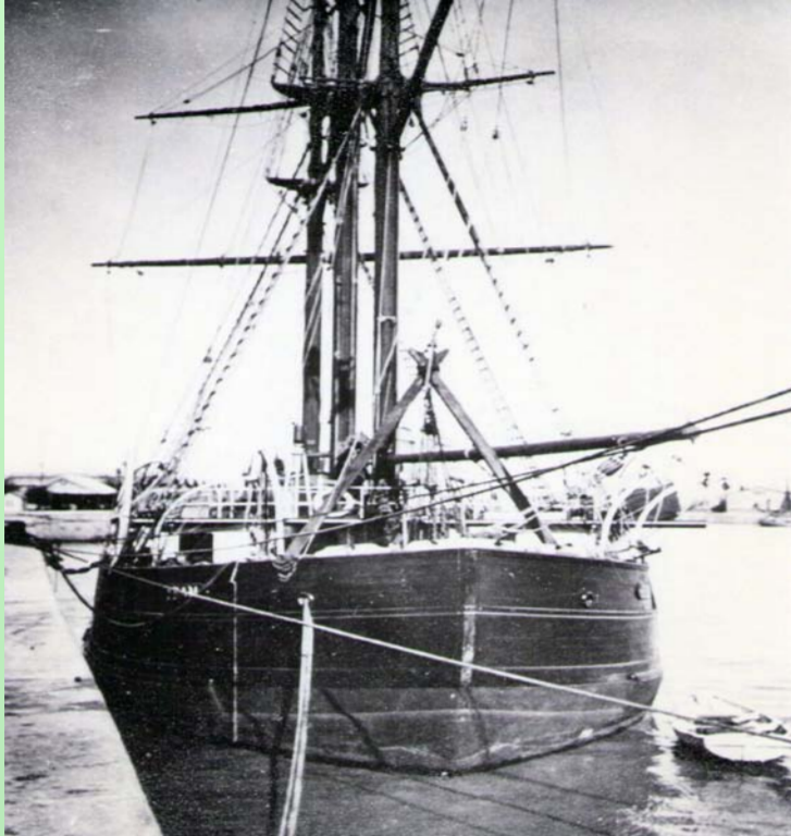
El Fram de Roald Amundsen en Bs. As.

Aunque de manera indirecta en un principio, la República Argentina sostuvo una activa participación durante la llamada "Etapa heroica" de las expediciones polares (1895-1922). Durante ese período, el puerto de la ciudad de Buenos Aires fue testigo del paso de varias expediciones científicas internacionales con rumbo hacia la Antártida, obteniendo todas ellas el apoyo de diferentes gobiernos con el consecuente interés periodístico y popular.