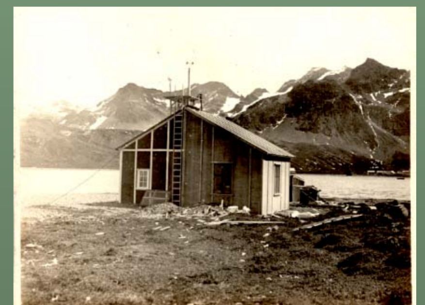
Estación Meteorológica Gritvyken. 1905.

En el caso específico de la Oficina Meteorológica Argentina, este organismo nacional colaboró entre otras expediciones, con la del Deutschland (Alemania) a cargo del citado Dr. Wilhelm Filchner, constrastando en el Observatorio Geofísico de Pilar, provincia de Córdoba y en Buenos Aires, parte de su instrumental meteorológico pero también y de manera mas efectiva con hombres e instrumental en asentamientos permanentes de carácter científico en la islas Laurie (Orcadas del Sur) en 1904 y San Pedro (Georgias del Sur) en 1905, participando de esta manera en el esfuerzo por afianzar la presencia nacional en el escenario antártico internacional.