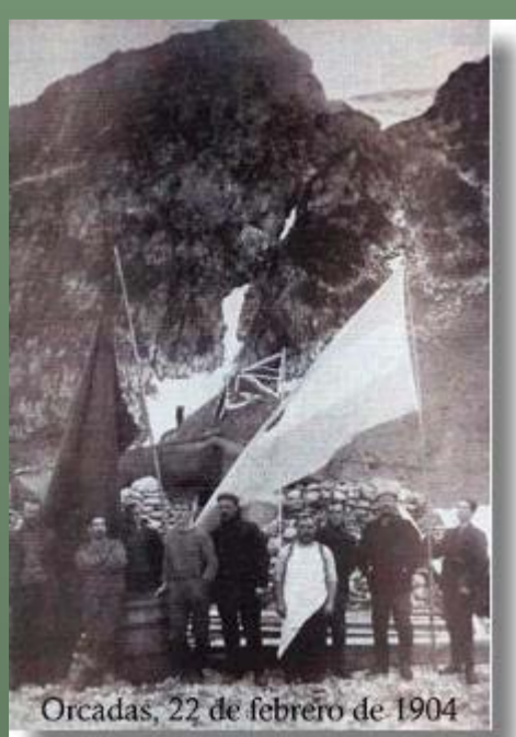
Estación Meteorológica Orcadas. 1904.

En el caso específico de la Oficina Meteorológica Argentina, este organismo nacional colaboró entre otras expediciones, con la del Deutschland (Alemania) a cargo del citado Dr. Wilhelm Filchner, constrastando en el Observatorio Geofísico de Pilar, provincia de Córdoba y en Buenos Aires, parte de su instrumental meteorológico pero también y de manera mas efectiva con hombres e instrumental en asentamientos permanentes de carácter científico en la islas Laurie (Orcadas del Sur) en 1904 y San Pedro (Georgias del Sur) en 1905, participando de esta manera en el esfuerzo por afianzar la presencia nacional en el escenario antártico internacional.