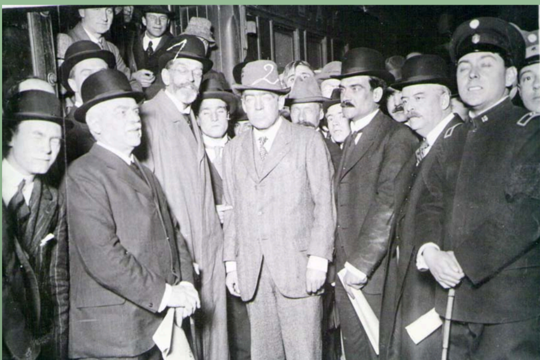
Ernest Shackleton en la Estación Retiro